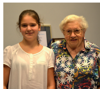
Jesień w Klubie Seniora