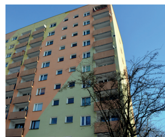
Modernizacje, inwestycje, remonty